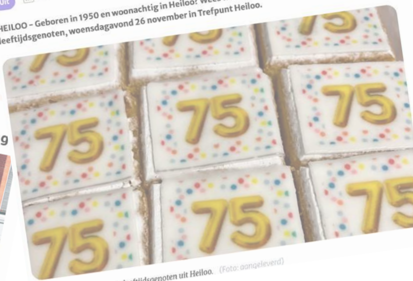
Vier het leven, samen met leeftijdsgenoten uit Heiloo.

HEILOO – Geboren in 1950 en woonachtig in Heiloo? Wees welkom op het verjaardagsfeest met leeftijdsgenoten, woensdagavond 26 november in Trefpunt Heiloo.