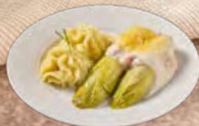
Witlofchotel met ham- en kaassaus