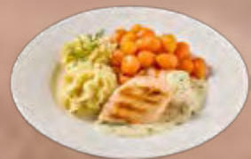
Zalmfilet in dillesaus met Parijse worteltjes