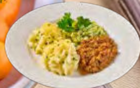
Gehaktschotel met prei à la crème