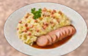
Zuurkoolstamppot met spekjes en rookworst