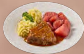
Runderlapje in jus met stoofperen

De vriesverse maaltijden in de Proefbox :