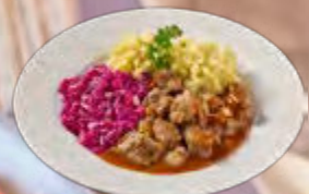
Jachtschotel met rode kool